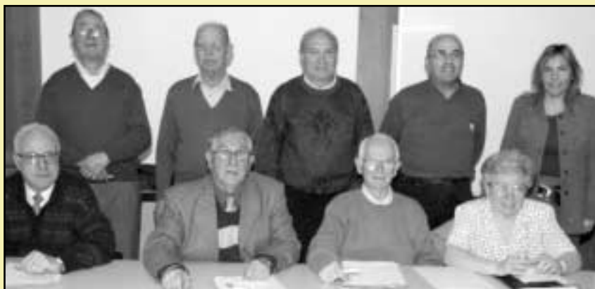
Foto de família dels actuals components de la Comissió de Gent Gran