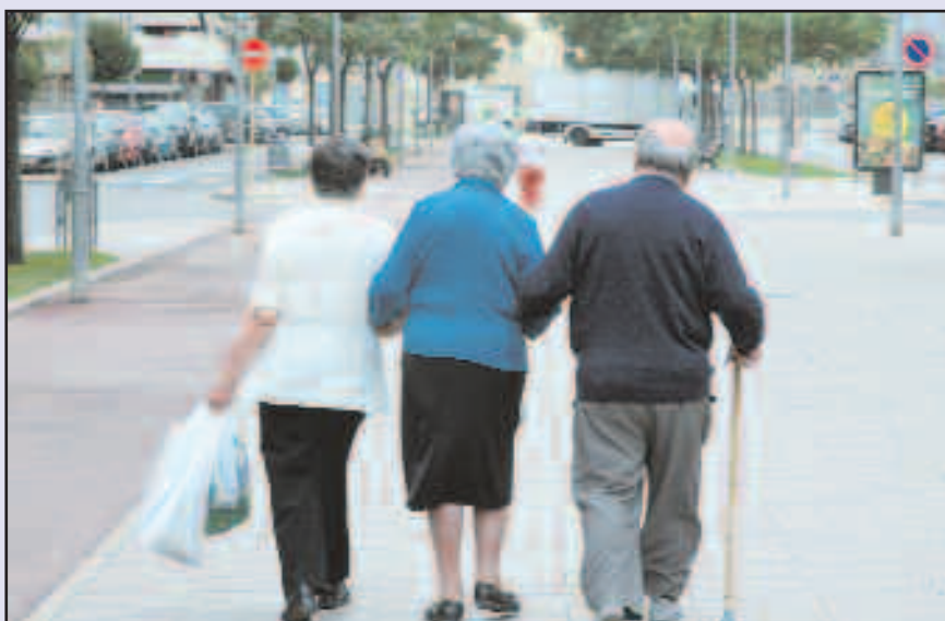
La ‘Ley de Dependencia’ mejorará la calidad de vida de muchas personas mayores

El proyecto ya ha sido respaldado por el Congreso de los Diputados