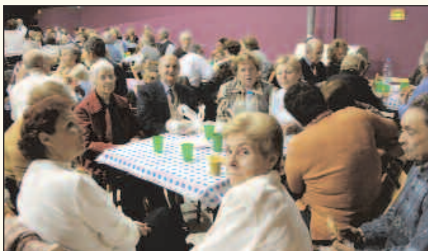
La fiesta de Navidad se ha convertido en un clásico punto de reunión para los mayores de Sant Joan Despí. Un buen lugar para desear a amigos y amigas unas buenas fiestas