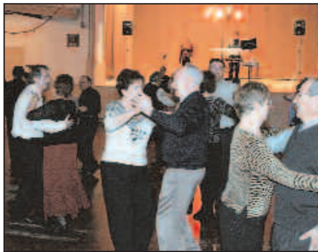
El món associatiu de la gent gran es mou per Nadal. A la foto, un dels balls de l'any passat

Per últim, el Club de Jubilats de Sant Jordi ha realitzat el seu ball de Nadal el dia 19 de desembre. Ara només cal gaudir i par-