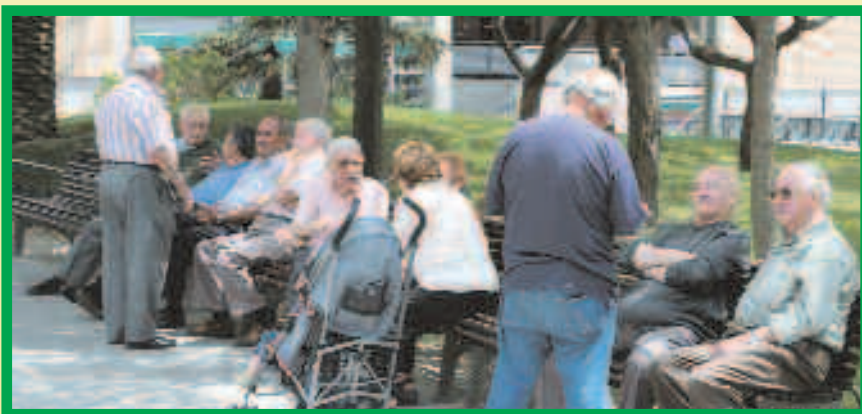
La plaça del Mercat, a les Planes, també acostuma a aplegar molta gent gran