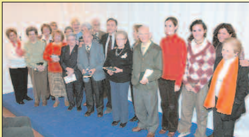
Els participants de la cinquena edició dels Premis de Relats Breus de la Gent Gran

Enguany s’han presentat un total de 14 narracions que demostren la important implicació