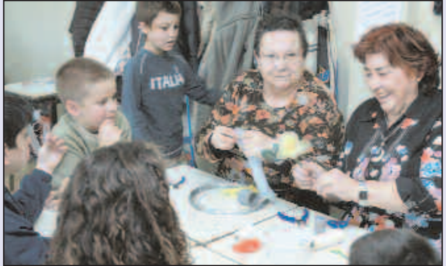
Una de les classes de manualitats que realitzen les voluntàries al Sant Francesc d'Assís