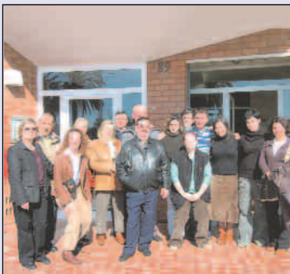
Els voluntaris del servei de teleassistència en una visita a l'empresa que s'encarrega dels aparells

voluntàries que ensenyen els majors de 60 anys a utilitzar les noves tecnologies al centre cívic de le Planes. Per últim, un grup de cinc voluntaris i voluntàries participen en la Comissió del Butlletí de la Gent Gran . Com no podia ser d'altra manera és la mateixa gent gran la que fa possible aquesta publicació tot proposant temes que els interessa i aportant les seves col·laboracions. El departament de la Gent Gran agradeix a tots els voluntaris i voluntàries la seva dedicació en aquest projecte.