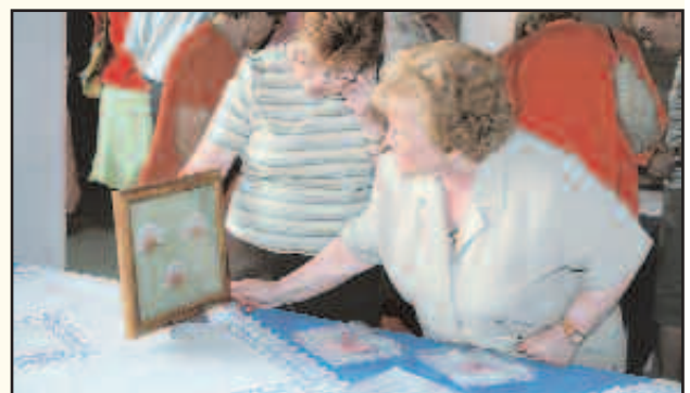
A l'esquerra, homentatge a les parelles que han fet les noces d'or i a la dreta, un instant de la inauguració de l'exposició de manualitats