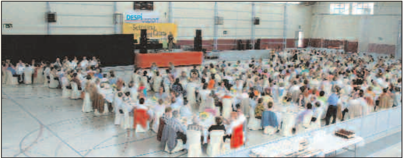
El 18 de maig es realitzarà el dinar de la gent gran al poliesportiu del Mig

Excursions, xerrades, balls, petanca, homentatge noces d'or, exposicions... són algunes de les activitats més destacades del programa