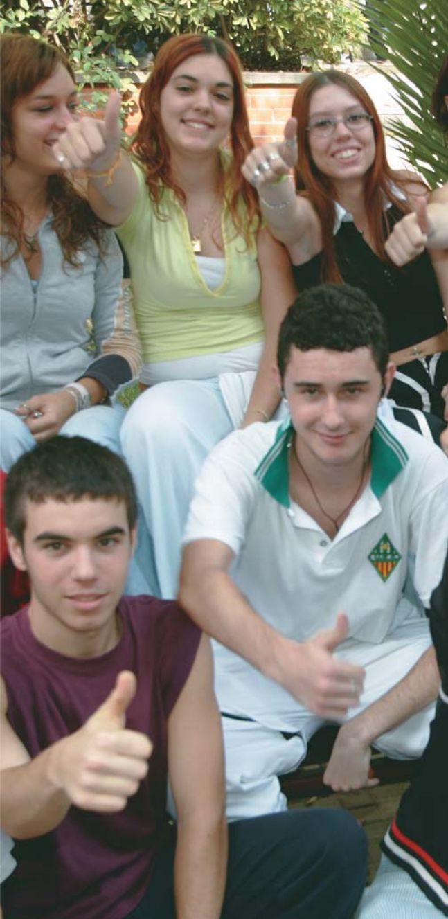
Seminaris d'idees i de creació d'empreses, tallers per millorar les capacitacions dels joves amb voluntat emprenedora... són algunes de les accions que planteja el programa Motiva