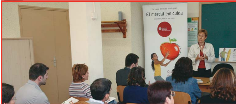
A dalt, un moment de la presentació al món comercial de la ciutat del projecte 'El mercat em cuida'. A la dreta, una de les parades del mercat ja ha penjat el cartell identificatiu d'aquesta iniciativa educativa

El mercat em cuida: Educació i comerç es donen la mà en un projecte adreçat als joves estudiants de Sant Joan Despí