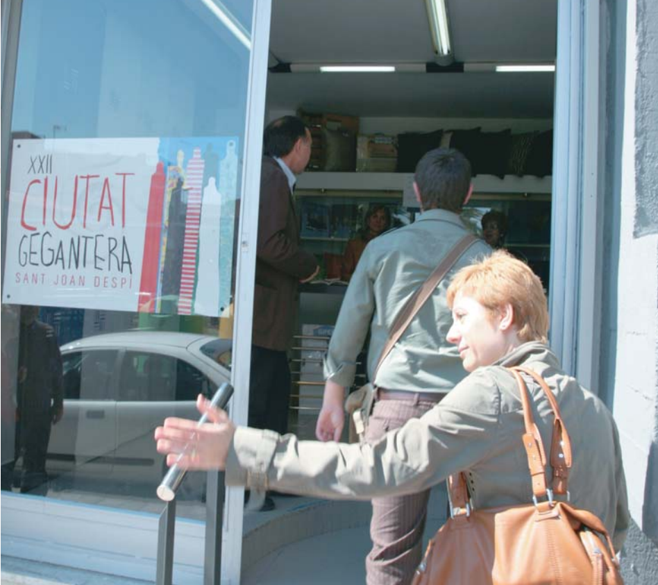
Tota la ciutat, també el comerç local, es va abocar per col·laborar a fer de la Ciutat Geganterera un gran èxit