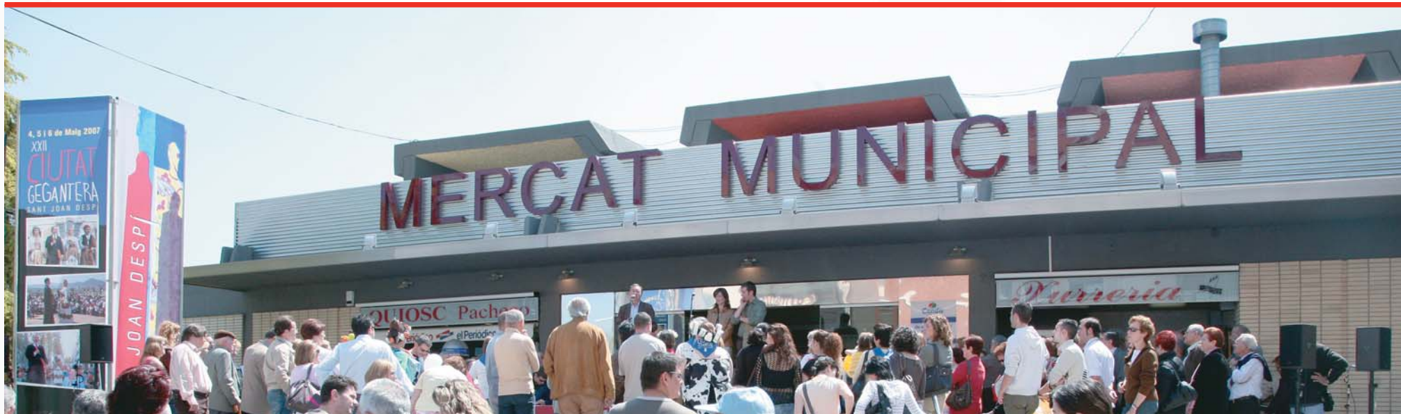
Façana principal del mercat municipal del barri de les Planes