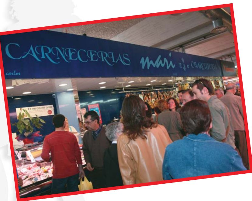
Les parades del mercat han estrenat també una nova retolació

Noves parades, una petita superfície comercial i, aviat, un nou aparcament milloren l'oferta del mercat