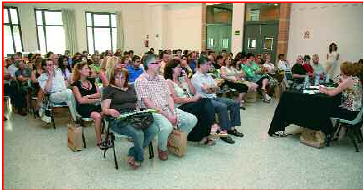
Ajuntament i comerciants, junts en l'acte de presentació del catàleg de serveis de l'Associació de Comerciants. A dalt, la marca Comerç Despí

Un any després de la seva posada en marxa, Sant Joan Despí disposa d'una Associació de Comerciants amb més de 120 associats i la feina feta a través de les actuacions que enumerem a continuació.