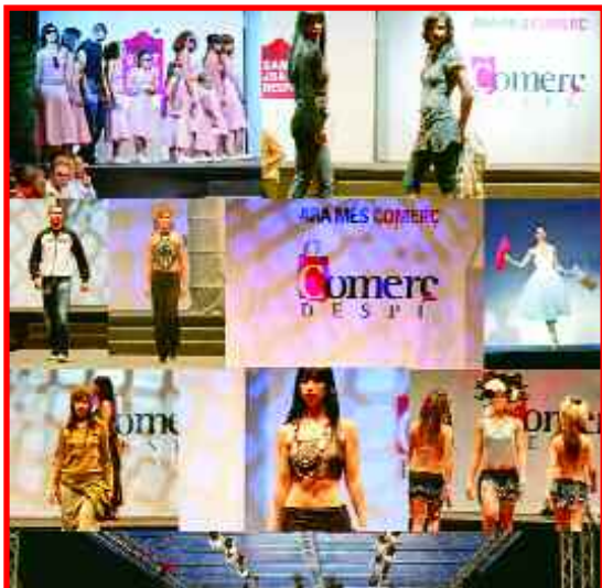
El comerç local, més present a la fira comercial de la ciutat