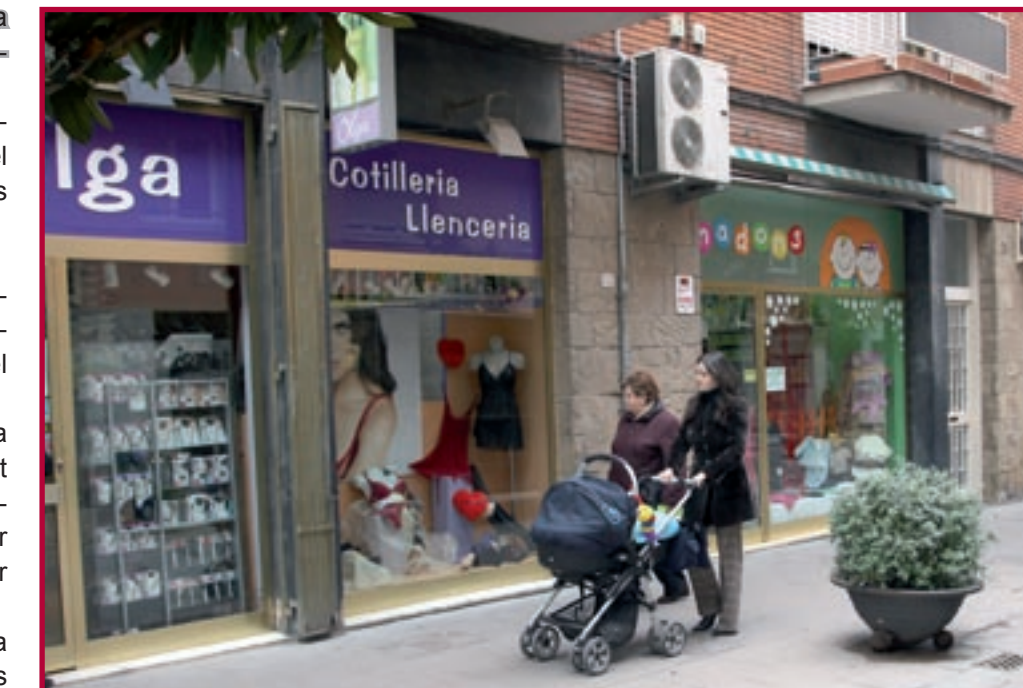
El programa Modernitza't ajudarà a que els comerços siguin més competitius i moderns

Departament de Foment de l'Ocupació i Comerç de l'Ajuntament