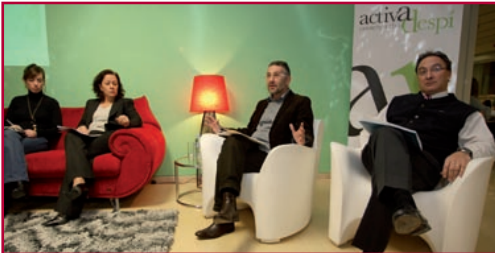
Els ponents d'aquest acte celebrat al Centre Cívic Torreblanca

que afecta directament els botiguers i botigueres de la ciutat. Cercant l'utilitat de la III a trobada del comerç local associat de Sant Joan Despí, van voler unir persones que pel seu treball quotidià podien oferir algunes receptes sobre com han d'actuar els comerciants per sortir de la crisi, optant per l'optimisme que s'ha de desplegar davant les situacions difícils.