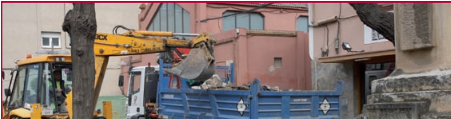
Les obres estan encaminades a dinamitzar la zona comercial a l'entorn del mercat del barri Centre

Les obres serviran, a més, per incorporar la xarxa de fibra òptica i renovar l'enllumenat amb columnes, tot renovant el mobiliari urbà i reordenant l'existent.