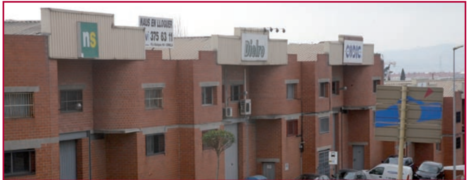
Les empreses gaudiran de subvencions per formar els seus empleats

Inclou formació teòrica i pràctica en matèria de prevenció de riscos, que sigui suficient i adequada al lloc de treball o la funció de cada treballador/a. Preferentment la formació orientada a prevenir les lesions més representati-