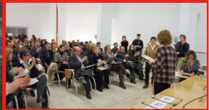
A l'esquerra, algunes de les dones participants al programa 'Igal@'t i fes-te lloc'. A dalt, un moment de l'acte de lliurament dels Segells d'Oportunitats, al Consell Comarcal