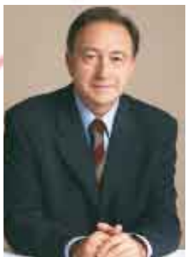
Antoni Poveda, alcalde

També mirem al futur apostant per la gent emprenedora que tenim a la ciutat. Per això aquest any construirem un nou centre d'empreses, de 500 metres quadrats. Un centre que volem sigui quelcom més que un 'viver' amb serveis per a les noves empreses. Aquest centre es planteja com un espai que tingui també activitat, que obri ponts, connexions i sinèrgies amb la resta d'agents econòmics locals. Treballem doncs, per una sòlida estructura econòmica amb garanties de futur.