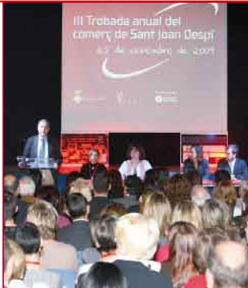
La tercera edició de la jornada anual de comerç de Sant Joan Despí, que va obrir l'alcalde (a la foto) va servir també per presentar la nova targeta Sant Joan Despí Comerç

L'objectiu és, doncs, seguir la línia encetada en 2009, amb actuacions importants també des del comerç associat, com la campanya El dissabte a la tarda, el comerç dóna espectacle que, per potenciar l'obertura i la compra els dissabtes a la tarda, van regalar entrades per a esdeveniments culturals i esportius de primer ordre: des del clàssic Barça-Madrid , als concerts de Depeche Mode o del Canto del Loco, passant per l'òpera Il Trovatore al Liceu.